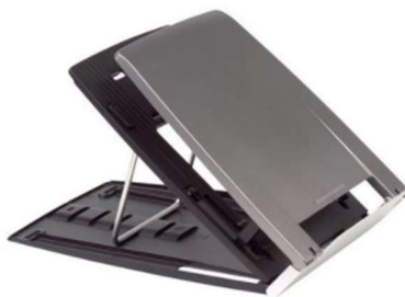
Figure 5 : porte PC réglable avec porte document