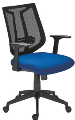
Figure 11 : Fauteuil de bureau