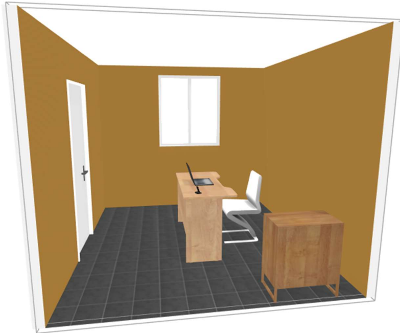
Figure 1 : Implantation type