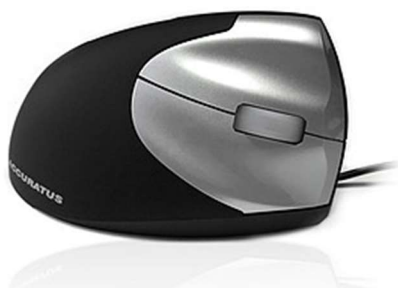
Figure 7 : Souris ergonomique filaire