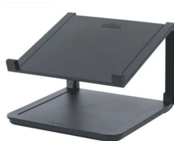
Figure 6 : porte PC fixe