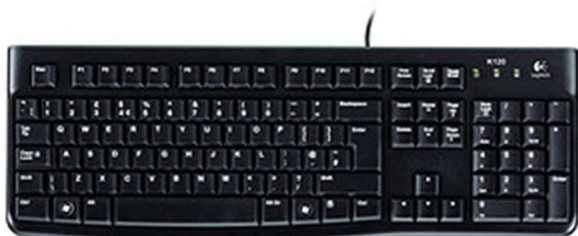
Figure 9 : Clavier classique