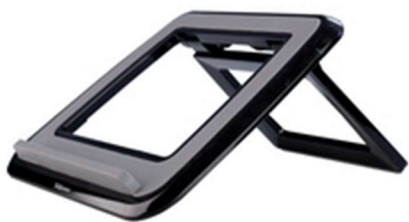
Figure 4 : porte PC réglable