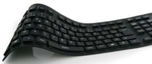
Figure 10 : Clavier souple (facilement transportable)