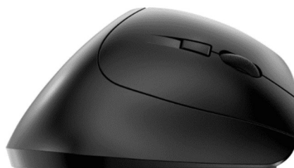
Figure 8 : Souris ergonomique sans fil